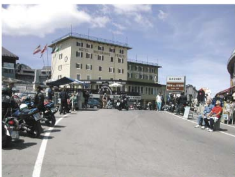
5. Stelvio-passet (I) 2760 moh. Heter Stilserjoch på den lokale dialekten av tysk(!) Mye besøkt av (særlig tyske) motorsyklister - samt de sprekeste selvpinnerne på tråsykkel. Veien er bare 3 m bred på det smaleste

Et av de mer spektakulære MC-treffene: Gudstjeneste med velsignelse av motorsykler inne i domkirken og 10.000 entusiastiske deltagere i paraden etterpå. Må oppleves! Slår du opp teltet på campingen i Castellazzo Bormida (småbyen med Madonna-kirken og startstedet for paraden til Alessandria), treffer du mange av de mer langveisfjærende treffdeltakerne der.