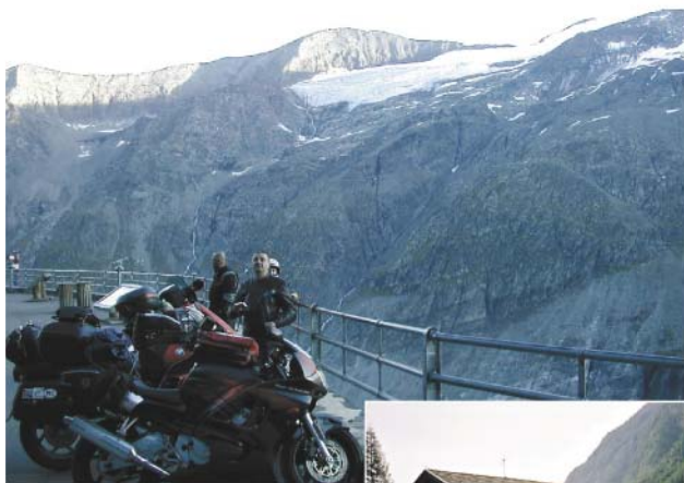
3. Grossglockner/Heiligenblut(A) 2503 moh (sidevei til Edelweißspitze, 2571 moh). Motorsykeltradisjonen på campingplassen i Heiligenblut ble i sin tid startet av SMC- medlemmer, men i dag er nordmenn i overtall. Hyggelig etablissement med utmerket kjøkken. Veien dit nordfra, Großglockner Hochalpenstraße, er intet mindre enn spektakulær.