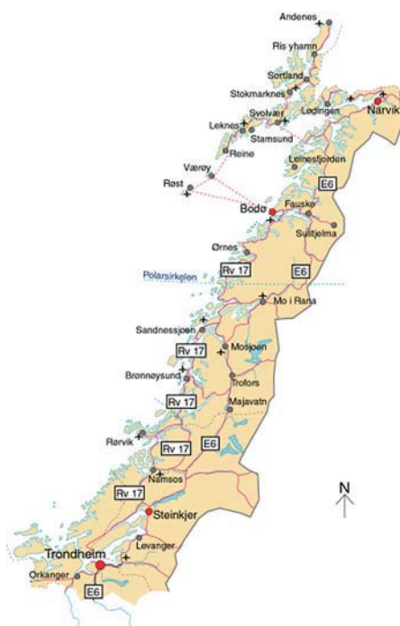
Kystriksveien går fra Steinkjer til Bodø

Den "naturlige" veien fra Bodø til Sortland er selvsagt via Lofoten. Vi valgte å ta ferge fra Bodø til Moskenes. Med mange biler og motorsykler på kaia var vi i tvil om vi fikk plass på ferga. Men positive, hjelpsomme og kreative fergemannskap sørget for at vi slapp å vente timevis på neste ferge. Turen tar fire timer og gir tid for både avslapping, naturopplevelse og prat over noen kaffekopper. Lofoten er natur, fiskevær og turister. Veiene er fine og det er mange muligheter for en avstikker bort fra hovedveien. Muligheten for å friste fiskelykken er også til stede.