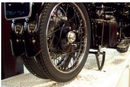
Brough Superior for sidevogn. Tvilling bakhjul med ramme og drivaksel mellom hjulene. Motoren er firesylindret og tatt fra en Austin Seven.

Og godt er det, for National Motorcycle Museum er, i all sin prakt, et fantastisk reiseemål for MC-interesserte mennesker. Er du i Storbritannia bør du absolutt legge turen innom Birmingham. Fra M42 er det bare å følge skiltene til NEC- The National Exhibition Centre.