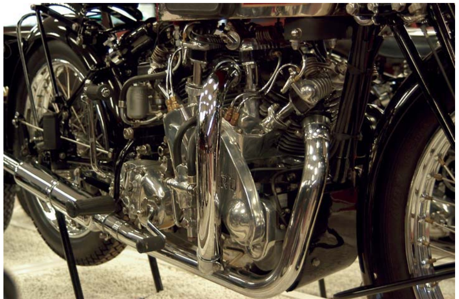
Hvem sa at finmekanikk tilhører våre dager? Dette er motoren fra en Vincent HRD fra 1937. 998 cc. og 45 hestekrefter. En fryd for øyet der den står på museet.