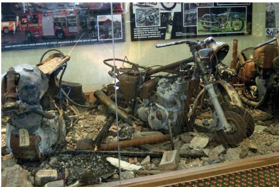
For at publikum bedre skal forstå hva som skjedde den forferdelige septemberdagen i 2003 har man plassert tre kvadratmeter av branntomta i en egen monter. Til venstre på bildet ser vi restene av en 1937-modell Vincent.

Som Fugl Fønix har The National Motorcycle Museum reist seg av asken - bokstavelig talt. Etter å ha blitt totalskadet i en brann for noen år tilbake, er museet nå gjenreist i sin opprinnelige form og størrelse.