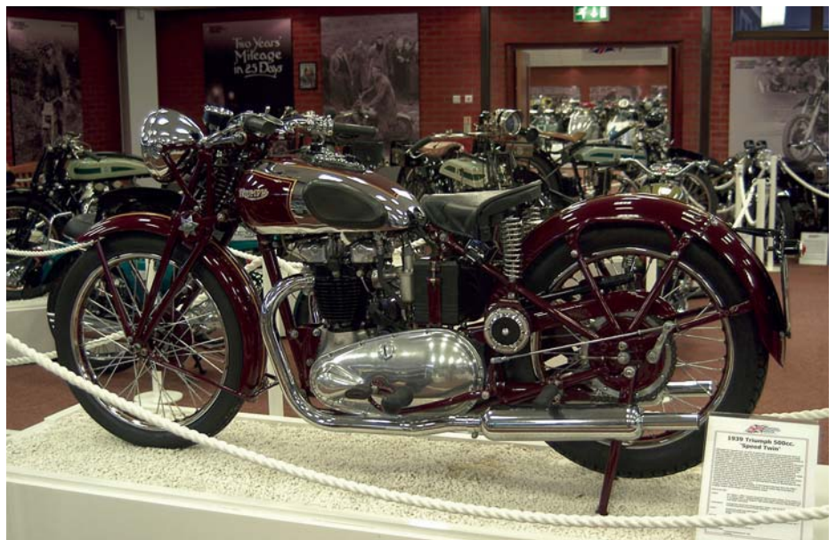
Triumph Speed Twin fra 1939. En av de store suksessene i engelsk motorsykelindustri. Med Speed Twin fikk parallelltwinnen sitt definitive gjennombrudd som drivkilde. En sykkel for "folket": Nypris £ 74 pluss £ 2,50 om speedometer var ønsket.