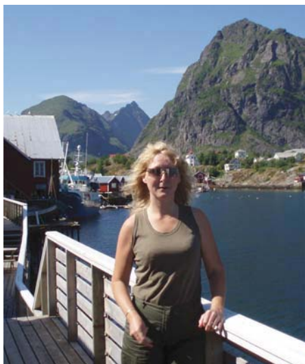
Overnatting i rorbu i Sørvågen, rett ved Å