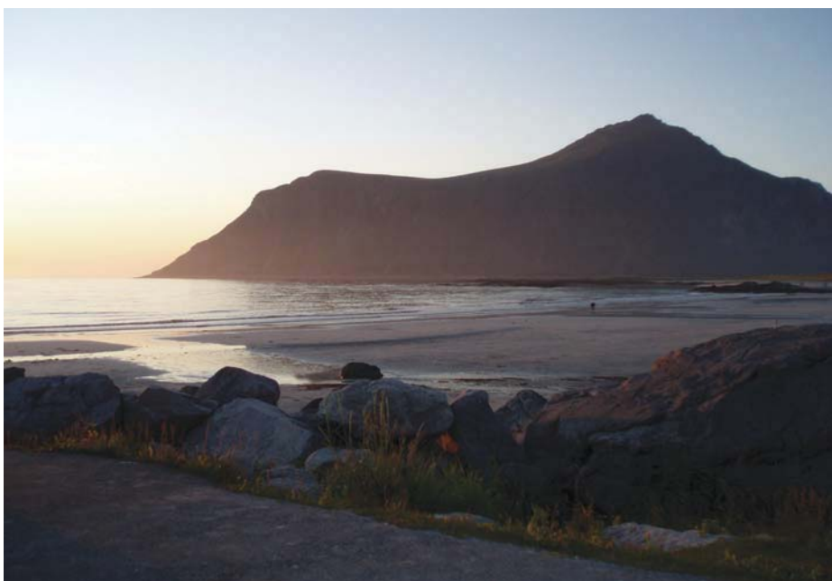
Fra nattlig spasertur på stranden

Så var det tid for prøvekjøring av Lofotens veinett. JIPPI! Det tidligere omtalte veistøvet som nå dekket syklene ble ikke bedre av å kjøre tunneler i Lofoten, men det var også det eneste som ikke var på plussiden. Nyasfaltør tørr asfalt, svingete veier gjennom et fantastisk landskap med klar luft, høye fjell, fosser og forskjellige uttrykk på de ulike øyene. Her hadde en gruppe bobiler funnet veien også, men de kunne passeres. Noen interessante svinger der man i godt driv møter en italiensk bil i innersving