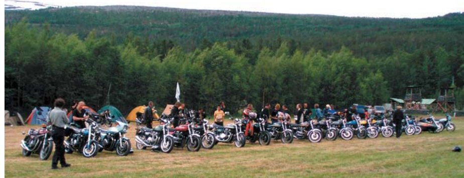
Vakre klassiske Kawa'er på rekke og rad

Den maten vi savnet om bord i båten, fant vi til gjengjeld i Lofoten. Kjøreturen gikk via Henningsvær