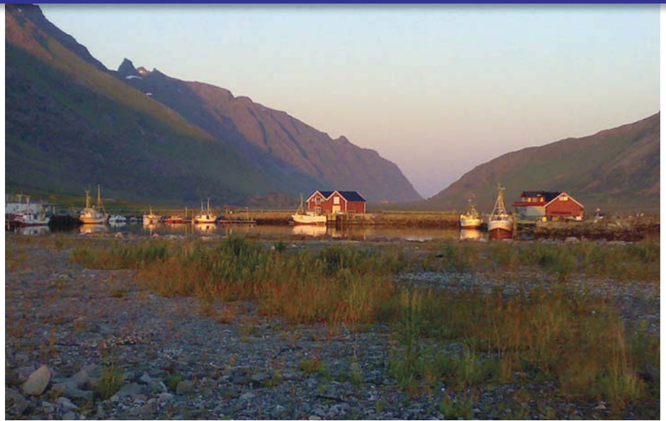
Klokka er 00:30 natt til 7. juni 2007 og midnattsola skinner over Lofoten

Det skulle ikke vi se på denne gangen, vi kjørte