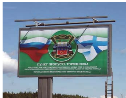
Skiltet på den russiske grensen

Etter nok et lite stykke kjøring fikk vi da svar på dette spørsmålet. Nå kom vi nemlig frem til den