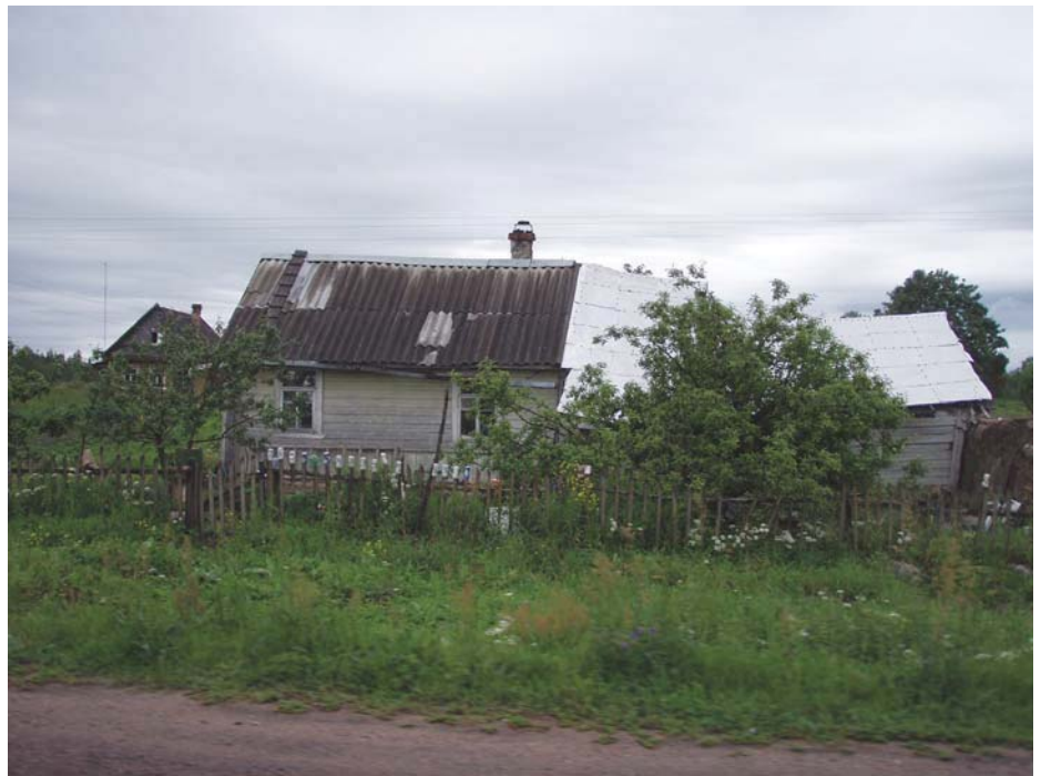
Typisk bolighus langs veiene i Russland. Sterk kontrast til praktbygningene inne i St. Petersburg.

Vi forlot byen for denne gang og kjørte ca 120 km sørover på E67 og fant et hotell ved hovedveien. Stedet heter Hallinga. På kvelden ble vi invitert ned på