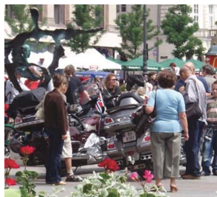
Folk i Øst-Europa var interessert i GW'ene