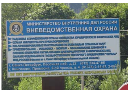
Det er ikke så enkelt å lese skilt i Russland

Vi bestemte oss for å overnatte like utenfor Vilnius og tok taxi inn til byen om kvelden. Vi så flere ganger to Gold Wing triker og en vanlig GW kjørende rundt i