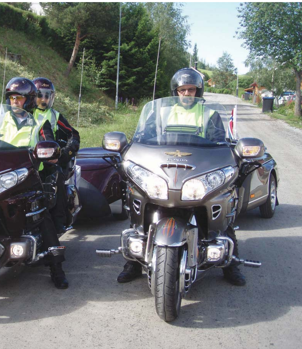
Avreisen fra Steinkjer

Vi kjøpte et forsikringsbevis til 140 kr og stilte oss nok en gang bakerst i køen. En nordmann i køen, som kjente det russiske systemet godt, kunne fortelle at årsaken til at vi måtte tegne forsikring var at så mange russere kjører uten forsikring. Det er vel kanskje ikke den rette enden å starte i for å få bukt med et slik problem? Men, så endelig - etter nesten tre timer - var alt OK og vi kunne fortsette.