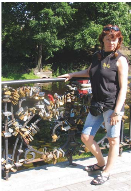
Par har festet hengelåser med navnene sine på bro i Riga, som symbol på kjærlighet