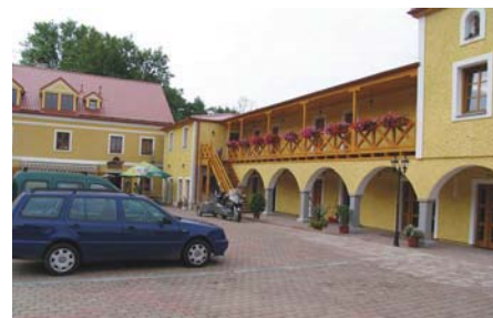
Stein hotell i Cheb