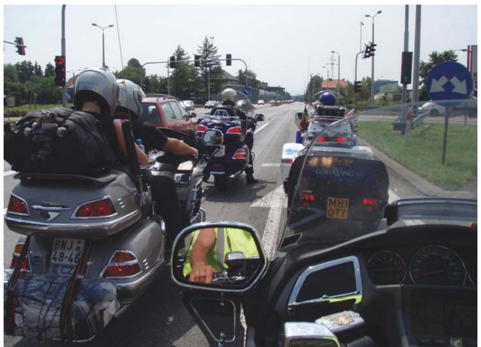
Internasjonalt turfølge: To tsjekkiske sykler, to norske og en fra Belgia