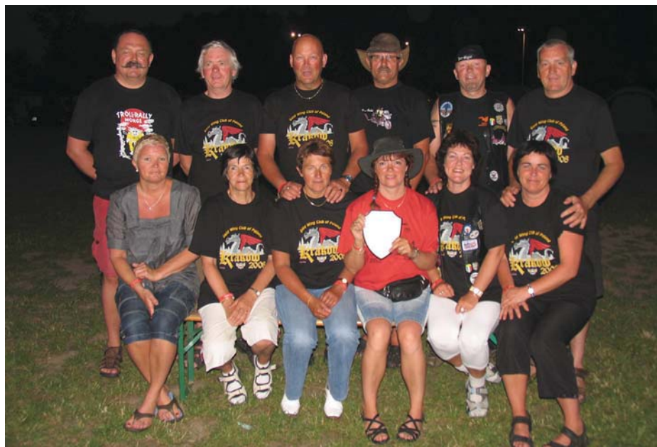
De norske deltagerne kom på fjerde plass under det internasjonale Gold Wing treffet i Krakow.

De eier som sagt dette hotellet samt et transportfirma med 60 trailere som går i Sentral-Europa. Til tross for at han er blant de rikeste i Tsjekkia er det en meget jordnær mann, som kjører sykkel og har begge beina plantet på jorden. Til hans hotell i byen Cheb er alle MC-kjører hjertelig velkomne. Hotellet heter Stein.