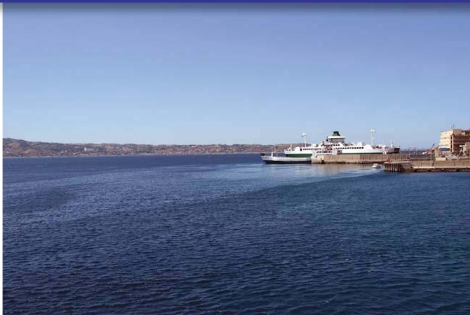
VESTFOLD: Den gamle Bastø-ferga "Vestfold" gjør nå tjeneste i Messina-stredet som skiller Sicilia fra fastlands-Italia.

Vi hadde tenkt å følge veien langs Amalfi-kysten, men vi fant ut at vi ville fortest mulig frem, så det ble autostrada i dag også. Jeg syntes jeg så Sicilia i det fjerne da vi entret Calabria, regionen som utgjør "tåa" på Italia. I dette området etablerte Itali-stammen seg noen århundrer før vår tidsregning - stammen som til slutt ga navnet til det moderne Italia. Så vet vi det.