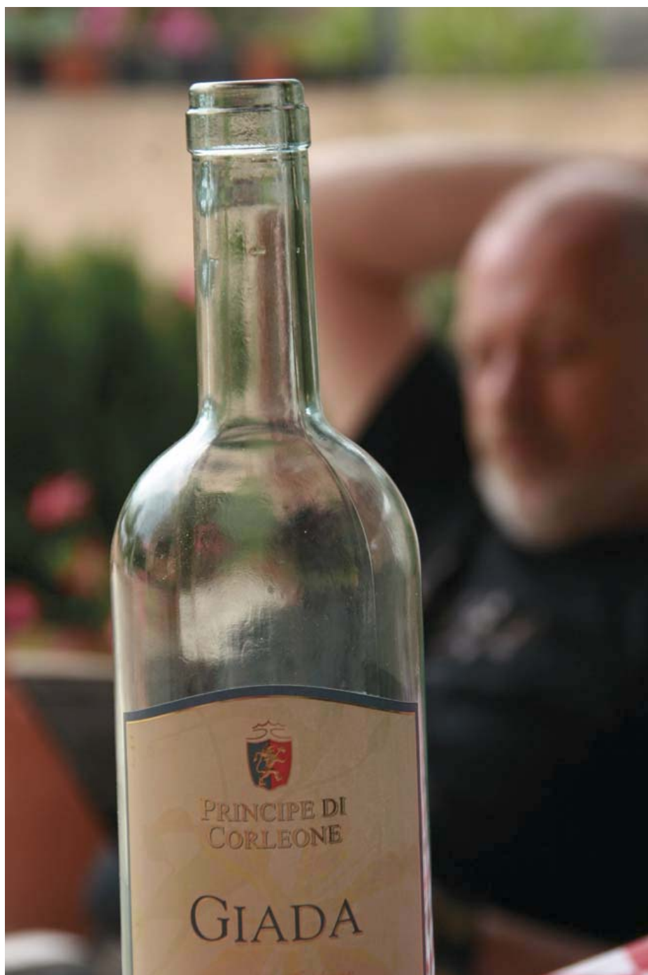
CORLEONE: Dette var det nærmeste vi kom Corleone denne gang: En Giada-vin fra Corleone-distriktet. En kulinarisk lynvisitt, om man vil.

Husk kontanter! Mens det i byene er lett å finne minibanker, kan det være svært vanskelig på den sicilianske landsbygda.